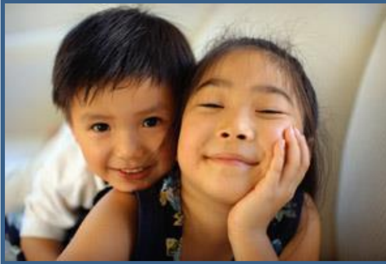
Legenda descrevendo imagem ou elemento gráfico.